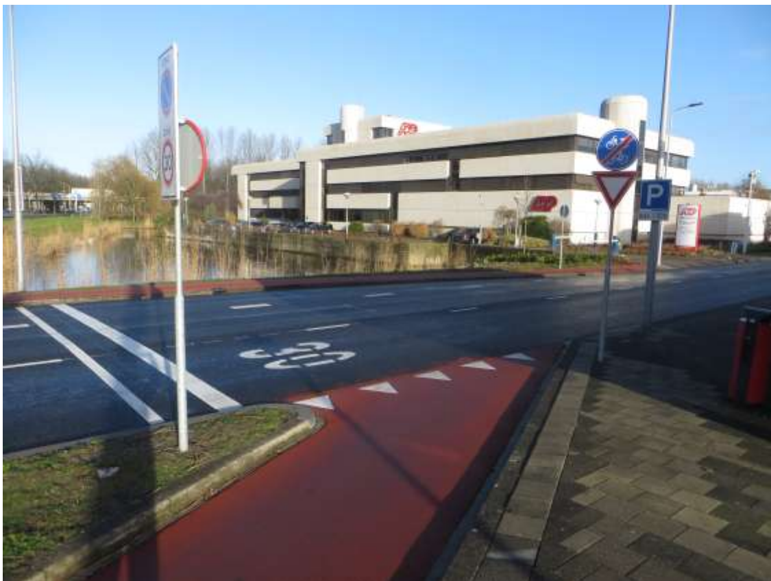
Aan de noordzijde langs de Lylantse baan heeft men richting de stoplichten een stukje tegel-fietspad aangelegd.