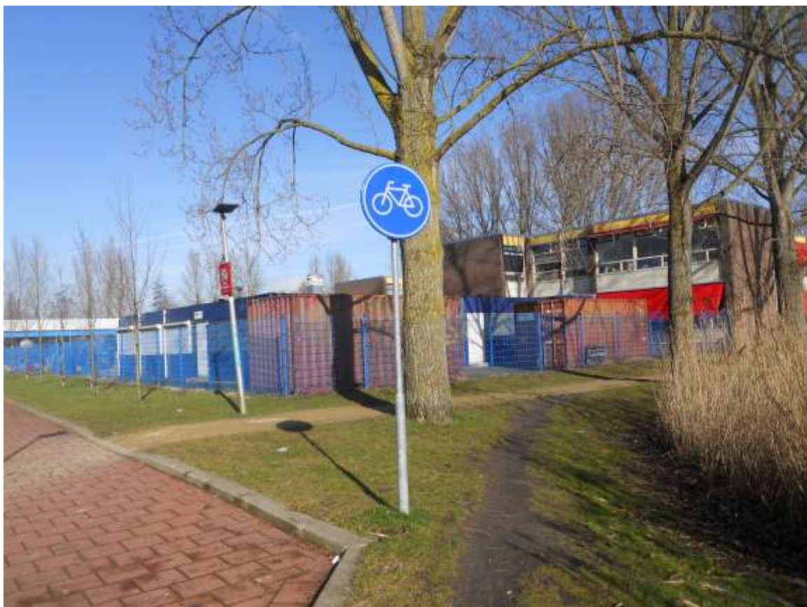
Olifantenpaadje naast het Schilderspad