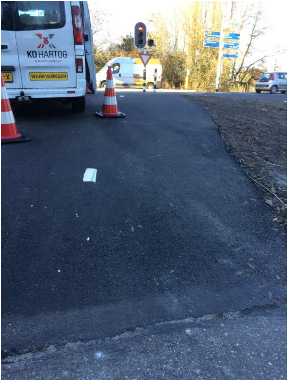
Zie de foto: De helling vanuit Hitland bij de fietsoversteek van de Abram van Rijkevorselweg bij de Klaas Klinkertkade bleek na de nieuwe asfaltering echt nog steiler geworden.