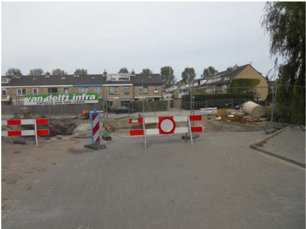
Omleiding van Schubertstraat naar Capelsebrug (onder)