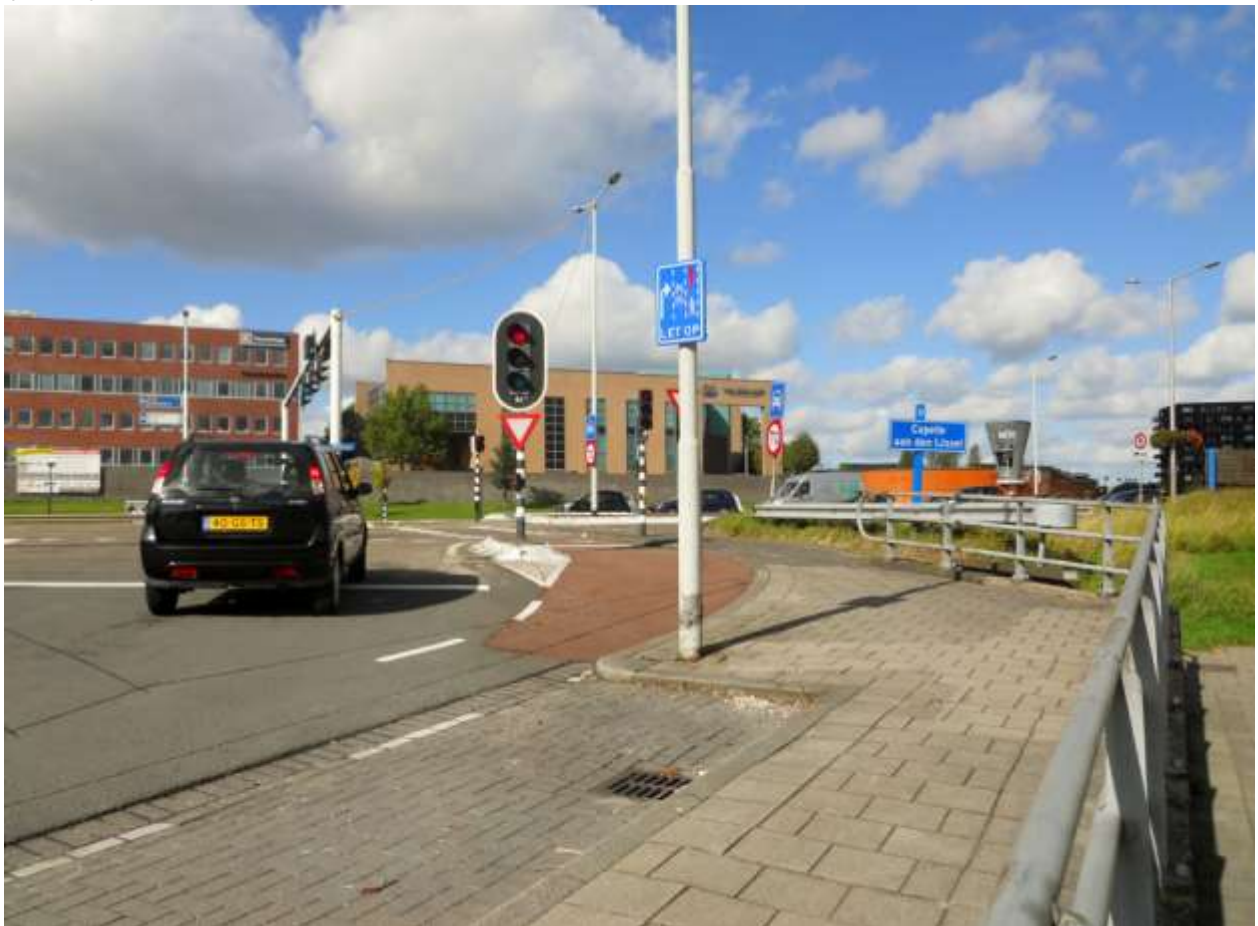
Foto: Oversteek IJsselmondselaan naar Fascinatio bij A. van Rijckevorselweg