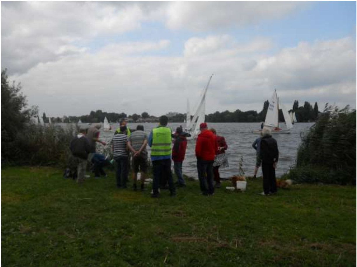
Foto: Verzamelen langs het water