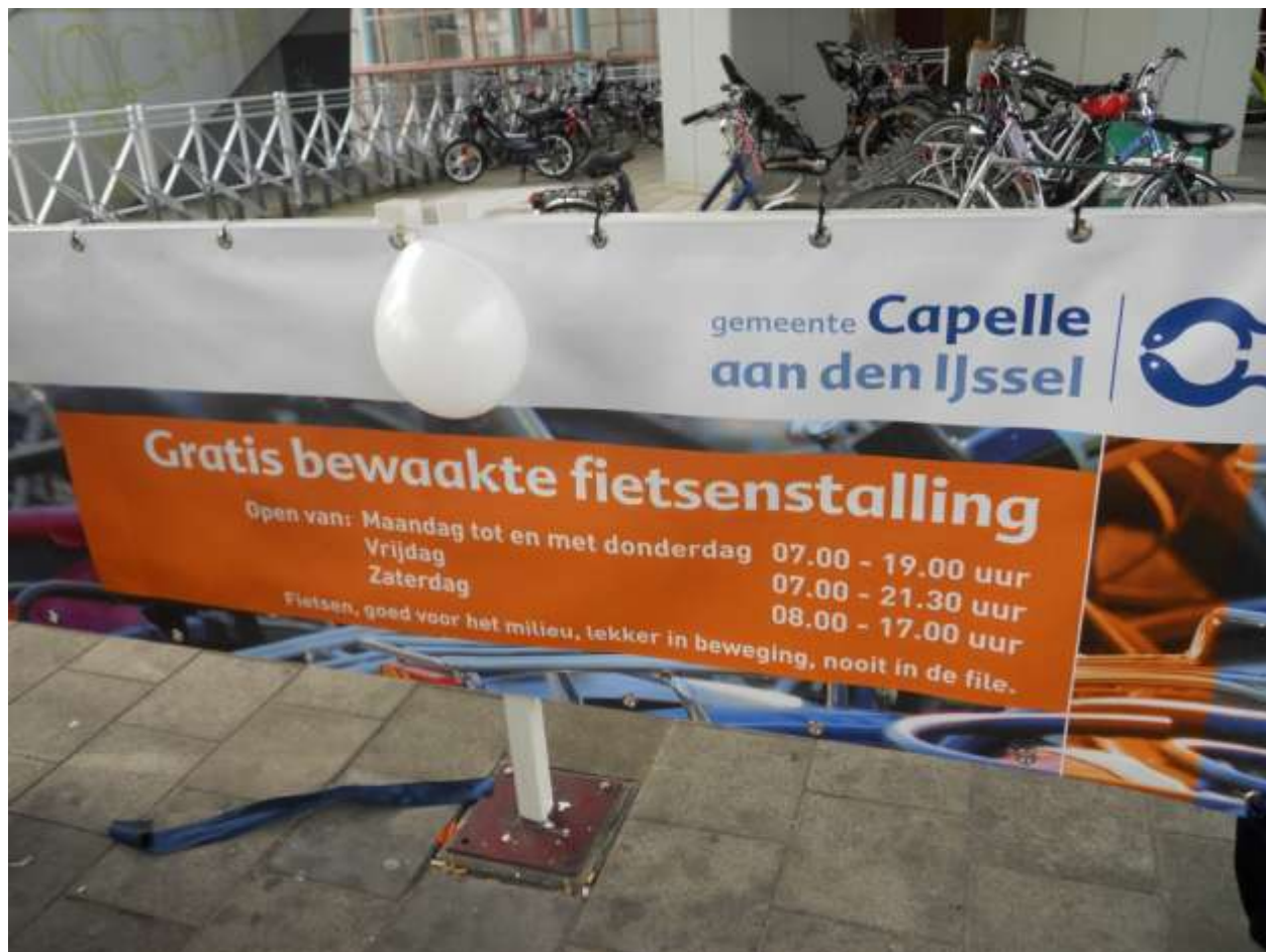
Foto: De bewaakte fietsenstalling bij de Koperwiek