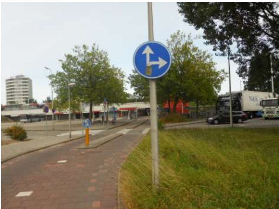
Foto: Kruising Capelsebrugpad met Rhijnspoor