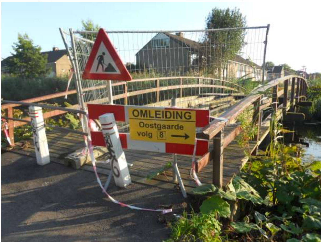
Omleiding Hollandsch Diep bij De Terp (onder)