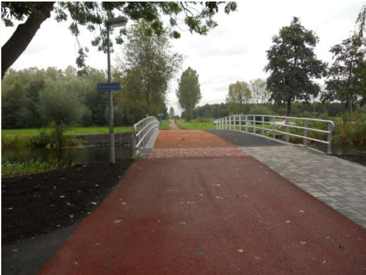
Foto: Nieuwe brug bij Dalpad naar Klaas Klinkerkade