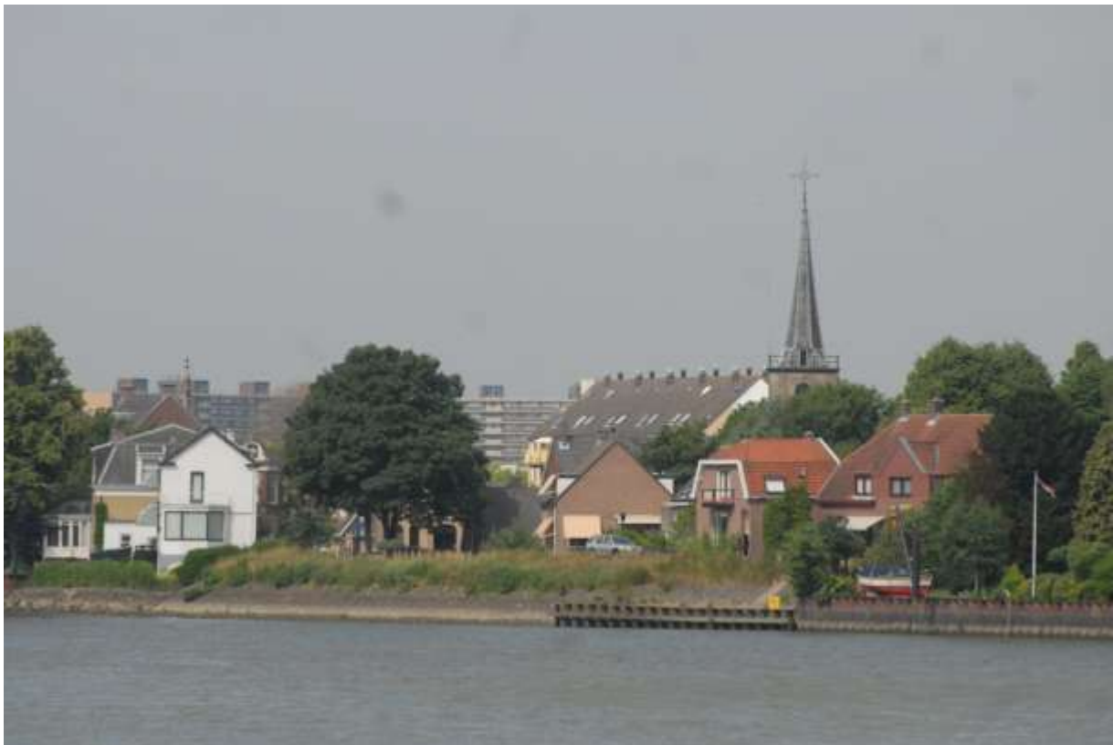
Foto: Capelle a/d IJssel met de oude dorpskerk uit 1593 met de flats op de achtergrond