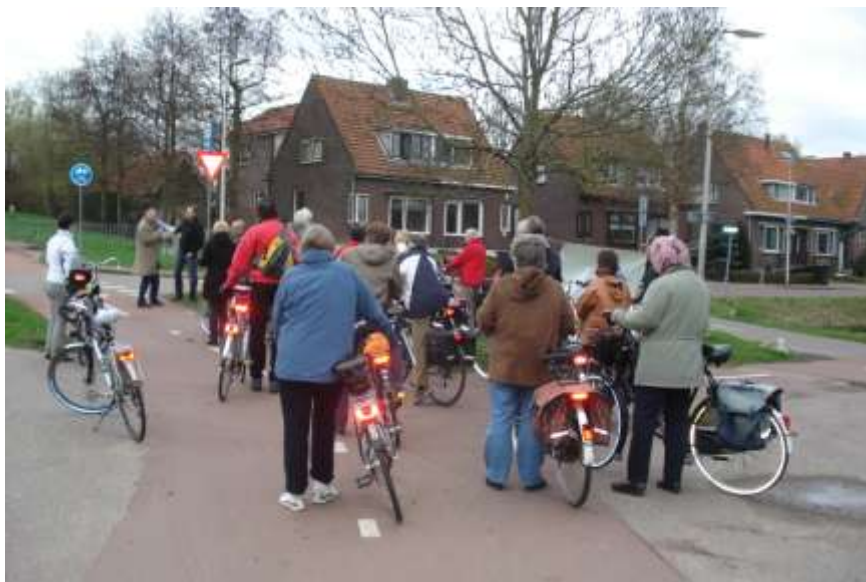
Foto: Vertrek vanaf het Pannenkoekenhuis