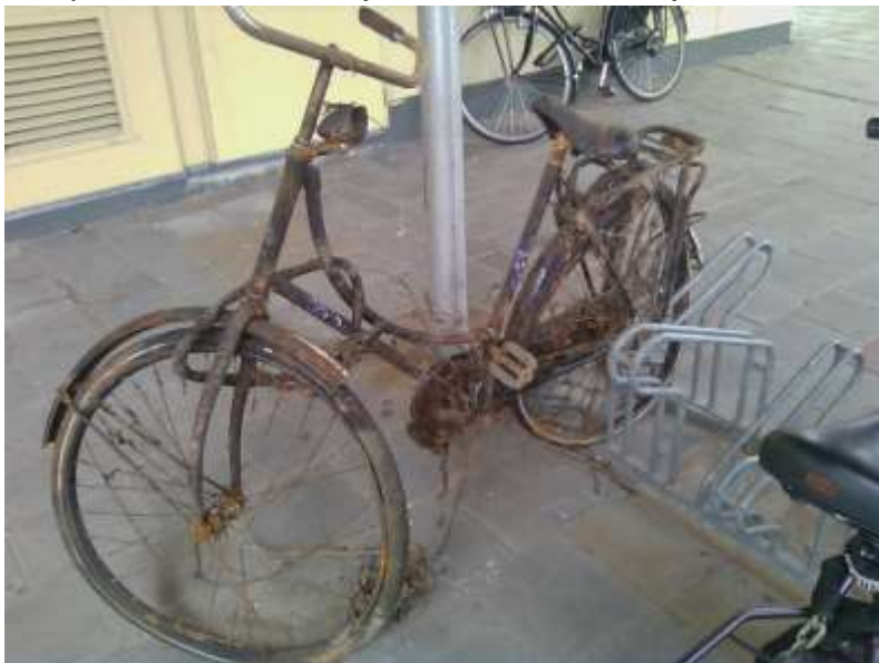
Fietswraak in Capelle a/d IJssel

Het standpunt van de Fietsersbond over fietsenverwijdering is dat niet in rekken gestalde fietsen slechts mogen worden verwijderd als zij hinder opleveren voor andere verkeersdeelnemers en (ruim) voldoende goede stallingen, met het fietsparkeur, in de nabijheid voorhanden zijn.