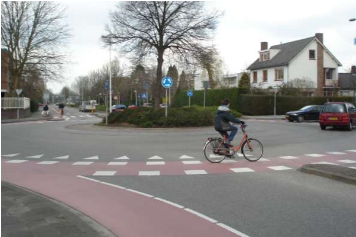
Foto: Fietser in de voorrang op rotonde Slotplein