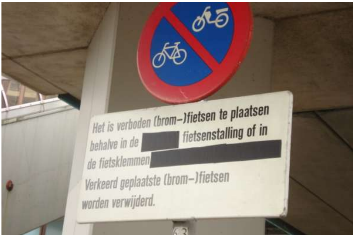
Foto: Verbodsbord bij Metro Slotlaan

De Fietsersbond was al eerder overtuigd van het legaliseren van een fietsenstalling onder de metrobaan en vindt, nu het zo duidelijk is dat deze proef is geslaagd, dat het verkeersbord met het parkeerverbod nu geen functie meer heeft en dus ook helemaal moet worden verwijderd. Erger is nog het amateurisme zoals het aflakken van tekst op een officieel bord. Bovendien geeft dit bord nu een verkeerd signaal af met deze waarschuwing dat, als een fiets maar even verkeerd is geplaatst (dus niet in een rek), die dan wordt verwijderd. Je moet fietsers niet verjagen met het handhaven van een verbodsbord. Deze kennelijk gekozen aanpak staat ook haaks op het beleid van de Fietsersbond.