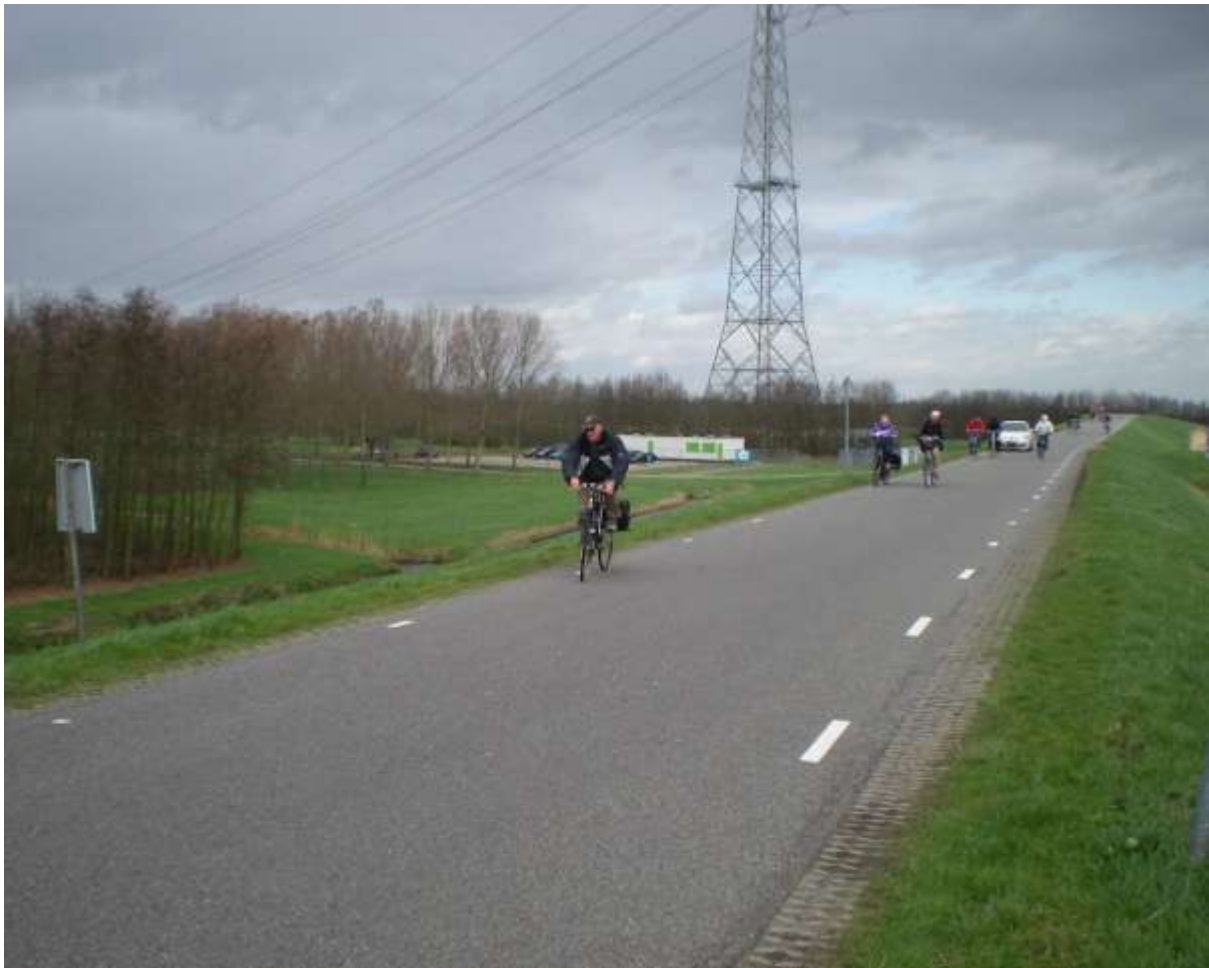
Foto: Fietsen tegen een krachtige stormwind op de dijk