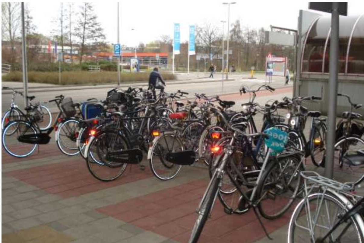
Foto: proef met fietsenrekken naast ingang metrostation Slotlaan

Onlangs zijn als proef de bestaande fietsenrekken, gestitueerd bij het P+R terrein aan de Lijstersingel, verplaatst onder de metrobaan naast de ingang van het metrostation Slotlaan.