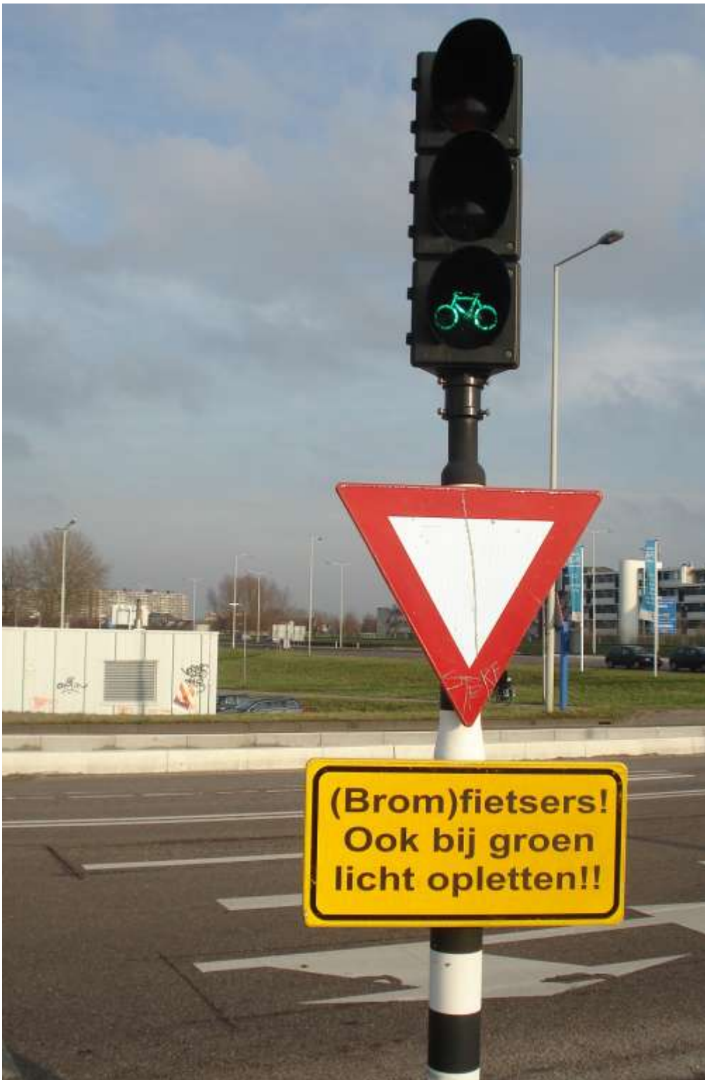
Foto: Fietsoversteek Van Beethovenlaan/Abram van Rijckevorselplein

Bij de fietsoversteek Van Beethovenlaan naar Abram van Rijckevorselplein is de gemeente Capelle a/d IJssel wel heel bezorgd om onze veiligheid. Heeft u ook in Capelle a/d IJssel iets opmerkelijks in het verkeer gezien, stuur het naar ons contactadres of mail het dan naar ons: vanwaardenberg@casema.nl