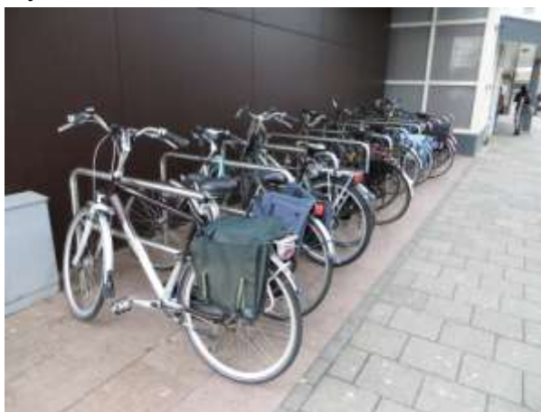
Nietjes bij de Jumbo

De eertijds door de Fietsersbond en GroenLinks in gang gezette kwaliteitsverbetering van fietsenstallingen gaat steeds meer in het straatbeeld verschijnen, we zijn er in het algemeen blij mee. Echter in ambtelijke kring is het nog lang geen vanzelfsprekendheid dat elke publiektrekkende locatie het beste af is met een afdoende aantal fietsnieten. Zo blijft winkelcentrum De Koperwiek wat dat betreft achter, hetgeen mede onderschreven wordt door de gemeente. Er heeft een schouw plaatsgevonden op verzoek van en met de exploitanten samen, waarbij men het geheel eens was dat er het een en ander moet worden vervangen. Maar omdat de gemeente hierin een bijdrage van 50 % in de kosten van deze exploitanten vraagt, is de urgentie blijkbaar niet meer zo hoog. Een patstelling dus, we moeten het voorlopig doen met de rij nieten bij en naast Blokker, en het kleine aantal nieten bij Jumbo.