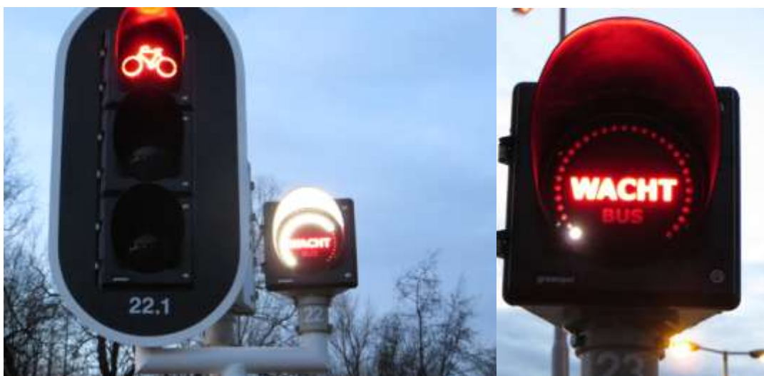
Het verkeerslicht met wachttijdvoorspeller

Mocht uzelf een dergelijke situatie tegenkomen: waarschuw ons per mail of uit zelf de klacht bij de gemeente (zie colofon).