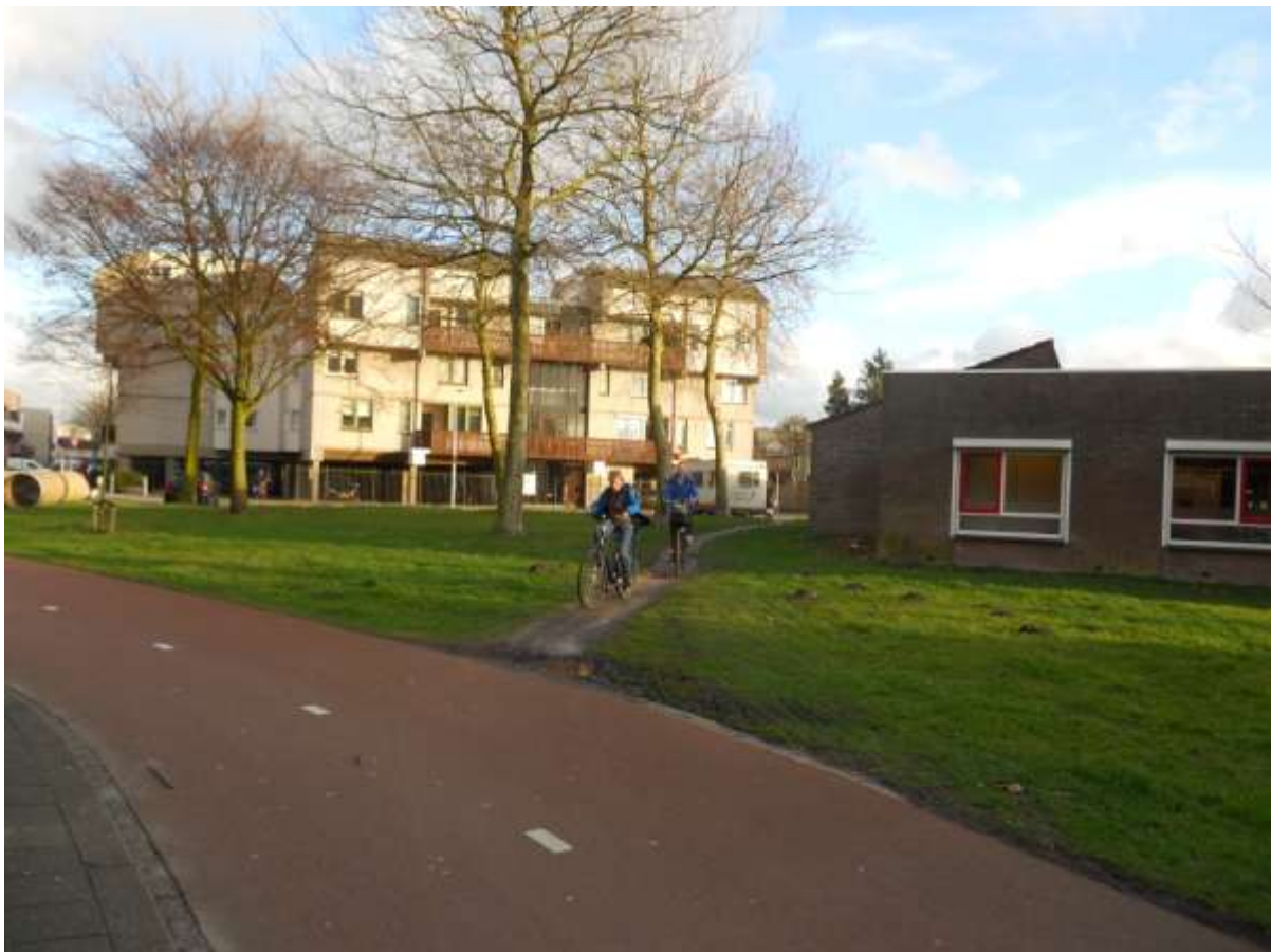
Olifantenpaadje bij de Klompendans