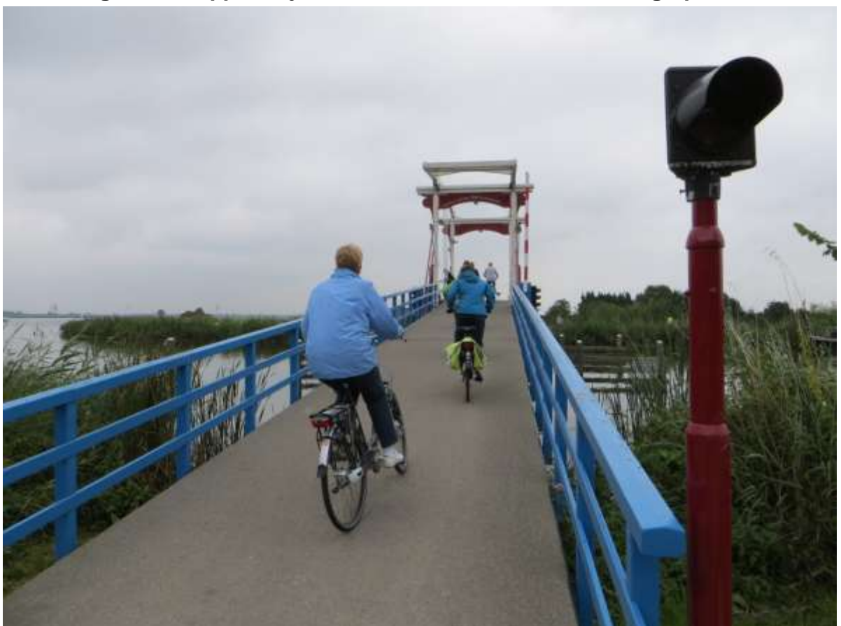
Over de Pekhuisbrug in Bleiswijk