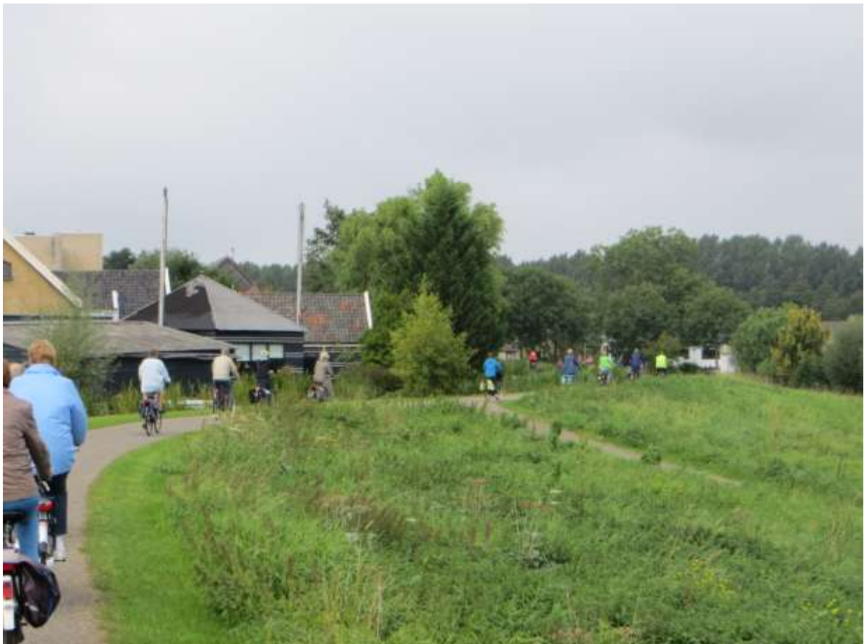
Onderweg in Nieuwerkerk a/d IJssel

Op zondag 15 september jl. hebben we weer een fietstocht georganiseerd in het kader van de landelijke Mobiliteitsweek. In tegenstelling tot voorgaande jaren werd er alleen op zondag gereden, maar wel weer een route die geheel stoplichtvrij was. Deze keer werd kennisgemaakt met het in ontwikkeling zijnde gebied bij de Rotte en Zevenhuizense plas, waarin ook de al geopende roeibaan ligt. De heenweg via Hitland en Nieuwerkerk langs de Tocht, en de terugweg via Oud Verlaat en een doorgaand fietspad door Zevenkamp naar Schollevaar. Bij de Rotte werd gepauzeerd voor de stroopwafels en naderhand voor de meegenomen boterhammen. In totaal was de afstand 35 km, voor een uitgebreide beschrijving van de route: zie onze website. Het belangrijkste was echter dat zo'n twintig enthousiaste fietsers bij mooi weer (wel wind) een leuke tocht maakten in voor menigeen onbekend gebied dat toch dicht bij huis ligt. Een aanrader dus voor komend jaar! Hieronder geven enkele foto's een impressie van de tocht. (JJ)