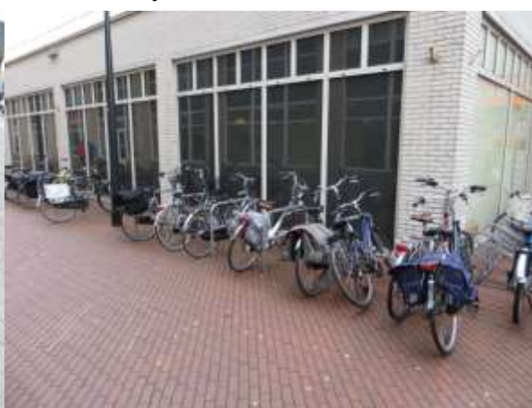
Nietjes bij de Blokker

Ook op het Stadsplein bij de ingang van de bibliotheek kunnen zonder veel problemen een aantal nieten worden geplaatst om de her en der slordig gezette fietsen een goede stallingsplek te geven. Hier hebben nota bene een aantal nieten gestaan tot een ophoging ter plaatse waarvoor ze zijn verwijderd. Nog altijd hebben we de betreffende ambtenaar niet kunnen bewegen tot herplaatsing, sterker nog: ons schriftelijke verzoek is bij herhaling nog steeds niet beantwoord. (JJ) Foto onder: De ruimte voor de bibliotheek.