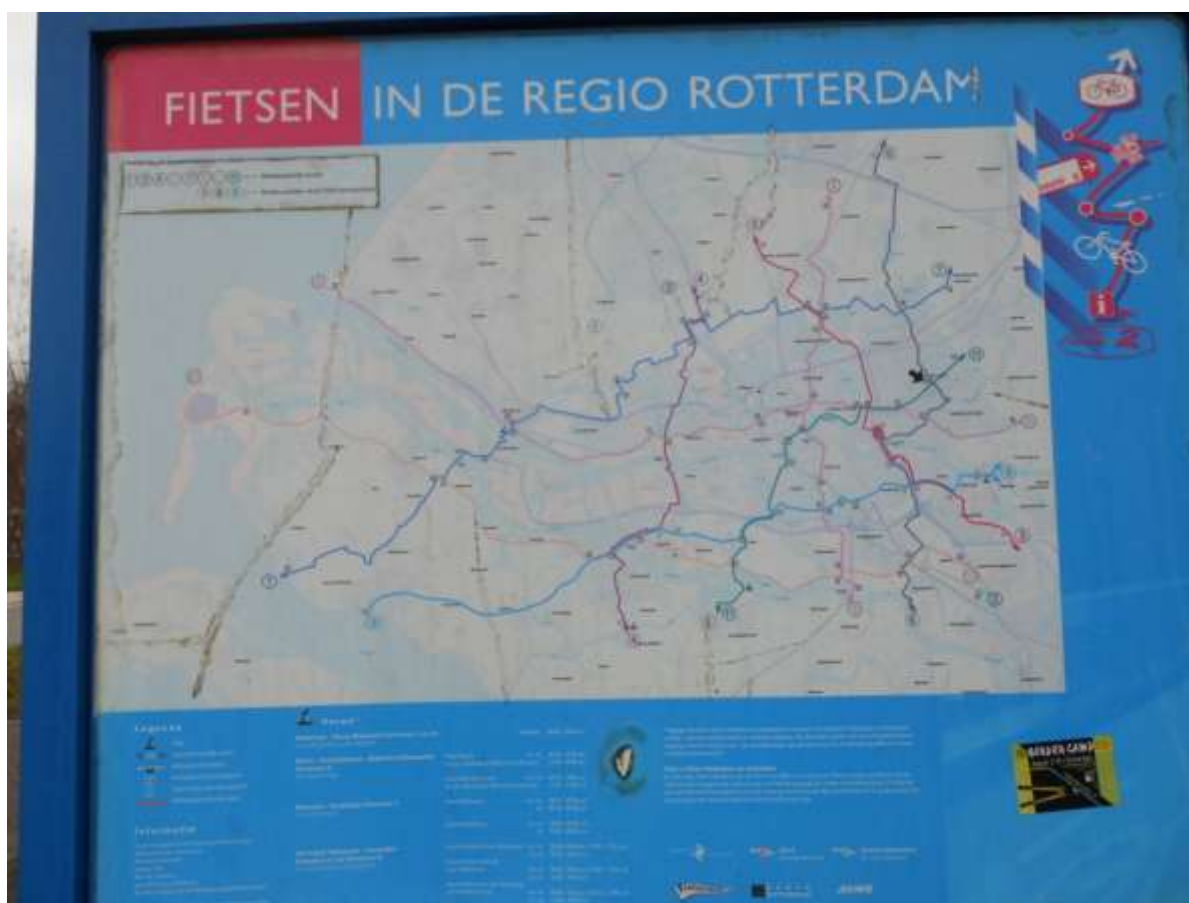
De regionale fietskaart

Bij ons in Capelle op de hoek van de Kanaalweg en de 's-Gravenweg staat al een aantal jaren een blauw informatiepaneel over fietsen met fietsroutes in de regio Rotterdam. Het staat er beetje vergeten bij. Er wordt dan ook al volop op diverse andere manieren bewegwijzerd in de regio via de knooppuntborden en de ANWB- borden. Wat kunnen we eigenlijk voor informatie vinden op dat blauwe informatiepaneel? Daarop staat een fietskaart afgebeeld van de regio met regionale fietsroutes die met een speciaal routenummer worden aangeduid via de ANWB borden. Op de kaart zijn in kleur samengestelde fietsroutes in de Regio Rotterdam aangegeven. De 's-Gravenweg maakt ook deel uit van een van de regionale fietsroutes. Zo voert fietsroute nr. 11 over de 's-Gravenweg van Oud Beijerland naar Nieuwerkerk a/d IJssel en wordt op de kaart in de groene kleur aangegeven. Verder staat op het informatiepaneel informatie over de veerdiensten, NS/stations en metrostations in Rotterdam en omstreken. Volg ook eens op de fiets de route vanuit Capelle of Nieuwerkerk naar Oud Beijerland via de boden van de ANWB-. Vanaf de Kanaalweg is het 20 kilometer. (EvW)