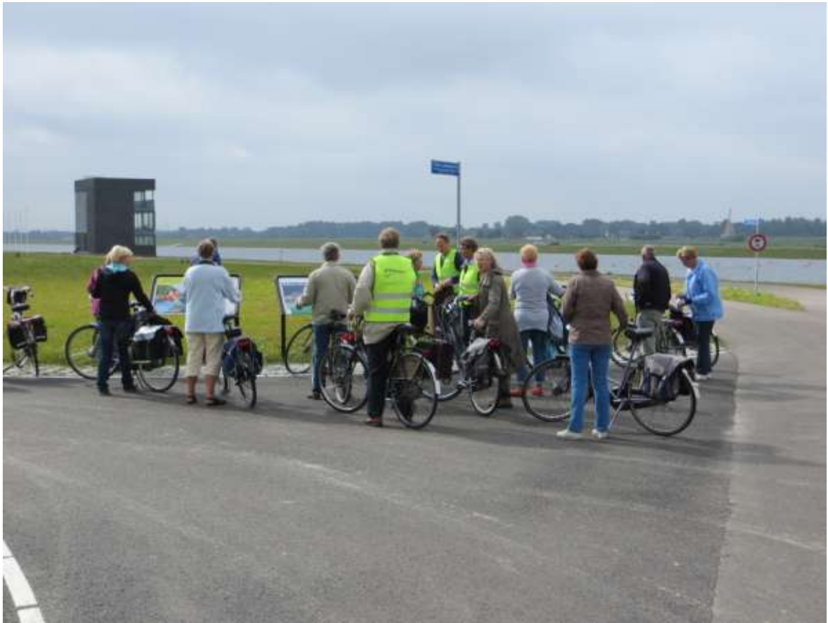
Onderweg even stoppen bij de nieuwe roeibaan in de Eendragtspolder