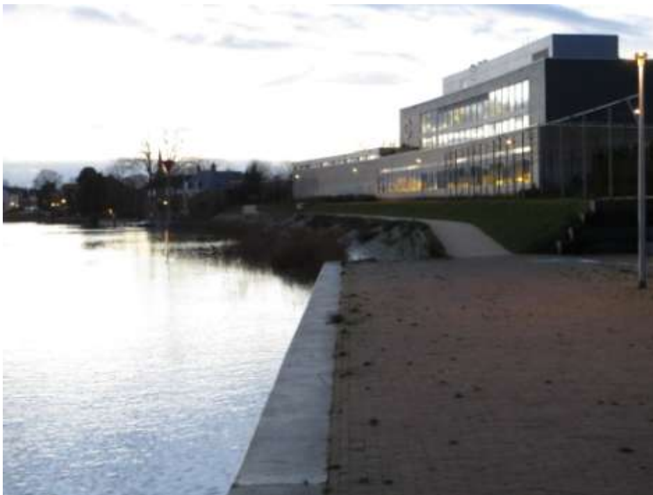
De toekomstige aanlegplaats in Capelle a/d IJssel