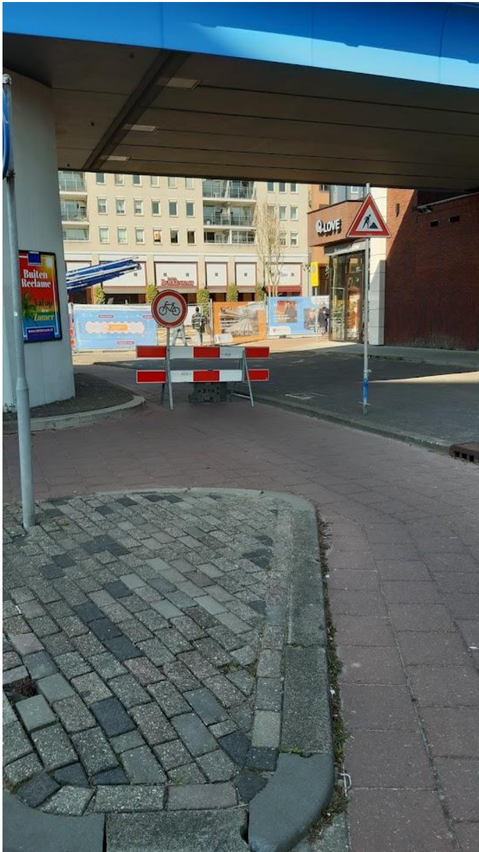
Fietspad Rivierweg was op 1 april plots afgesloten. Geen 1 april grap!