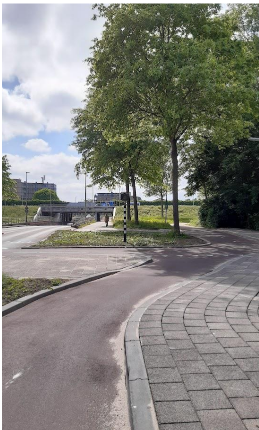
Aangepaste kruising richting tunnel

De Schönberglaan was een aantal weken voor een deel afgesloten vanwege werkzaamheden. Daar is ter hoogte van de Blinkerttunnel de kruising aan beide kanten voor het fietsverkeer aangepast. Dit is gedaan om de veiligheid voor fietsers te verbeteren. De weg werd gewijzigd op een manier dat fietsers beter zichtbaar zijn voor het autoverkeer. De kruisende oversteek voor fietsers en voetgangers en de omliggende fiets- en voetpaden zijn nu anders ingericht. Die sluiten nu beter aan op het kruisende Johan van Veenpad, het fietspad dat parallel loopt aan de Algeraweg. De aanpassing was volgens de wethouder noodzakelijk want de kruising tussen het autoverkeer op de Schönberglaan en het naastliggende zou te gevaarlijk zijn omdat daar tussen 2018 en 2023 9 ongelukken zijn gebeurd. Volgens de wethouder zorgde de oude inrichting voor verwarring bij autobestuurders of fietsers wel of niet gingen oversteken. Het keuzemoment om over te steken lag kort op de weg. Het risico op ongelukken was daarmee vergroot. Na de aanpassing is het fietspad uitgebreid naar een breedte van 3,5 meter. Om dat mogelijk te maken zijn de drempels opgeschoven en de paden geasfalteerd samen met de rest van het plateau.