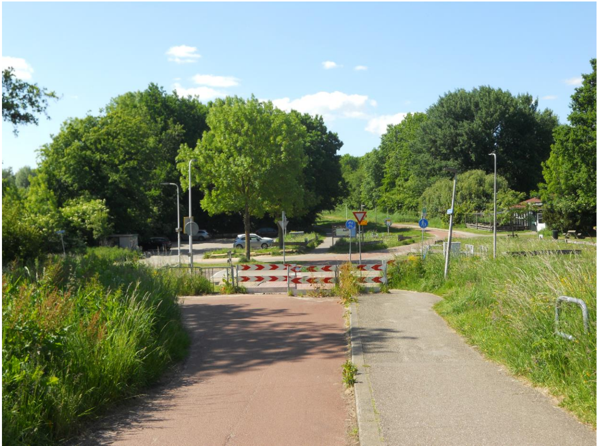
Fietssluis bij het Golfbaanpad/Bermweg