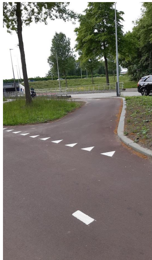
Aangepaste kruising richting De Blinkert