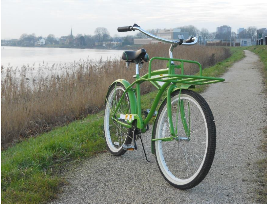
Afdeling Capelle aan den IJssel