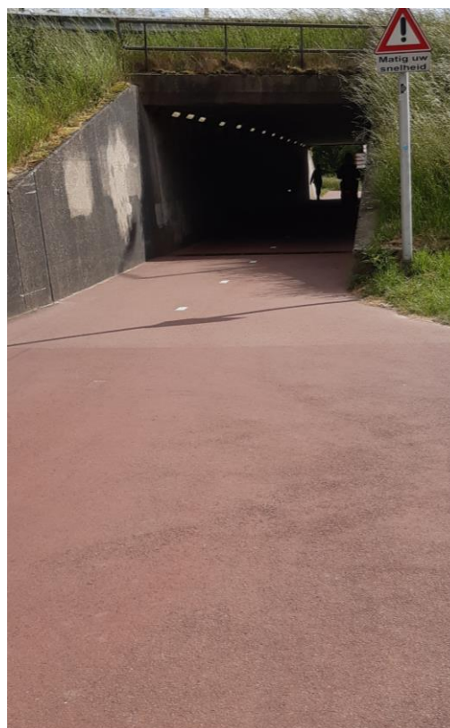
Geen overzicht vanuit de tunnel

In het kader van de aanpak van de Algeracorridor, bij de herziening van de Algeera-aansluiting zal over enkele jaren ook het tunneltje aangepakt worden omdat hij niet voldoet aan de grote stromen fietsers en andere gebruikers. Op welke wijze (verbreding of een extra tunneltje) moet nog besloten worden.