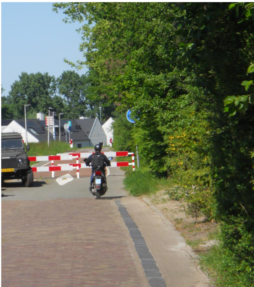
Fietssluis op de Groenedijk