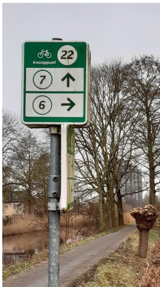
LF-routes door Hitland